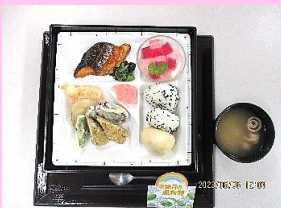
6/6 あじさい御膳 ・ かたつむりケーキ