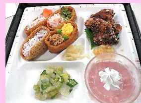
6/15 県民の日メニュー

他、【4月】春御膳、昭和の日メニュー 【5月】子供の日メニュー、母の日メニュー 【6月】父の日メニュー など