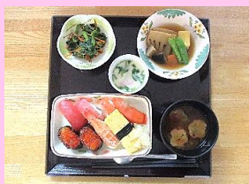
4/12 12周年 握りずし